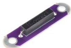
Sensor LilyPad Reed