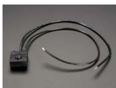
Interruptor por pulsación