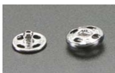
Botones de presión 1 de 5 mm