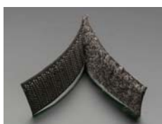
Velcro ® conductor